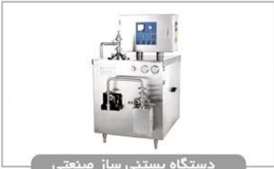
دستگاه بستنی ساز صنعتی