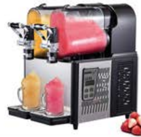
دستگاه یخ در بهشت