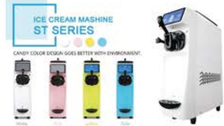
دستگاه بستنی رومیزی