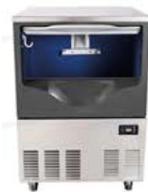
دستگاه یخ ساز