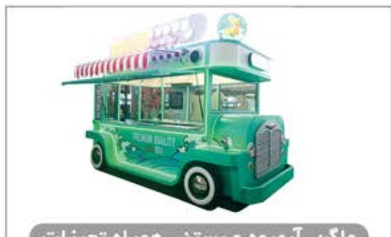
واگن آبمیوه و بستنی همراه تجهیزات