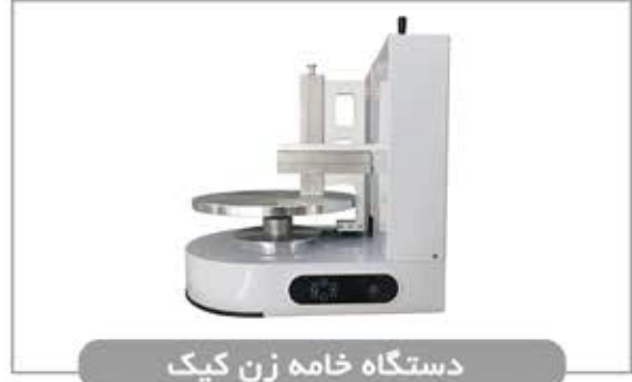
دستگاه خامه زن کیک