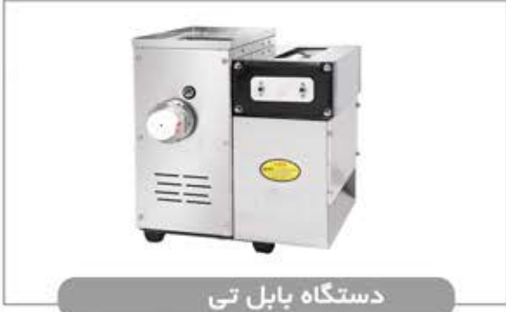
دستگاه بابل تی