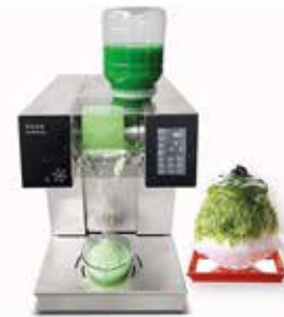
دستگاه یخ بستنی