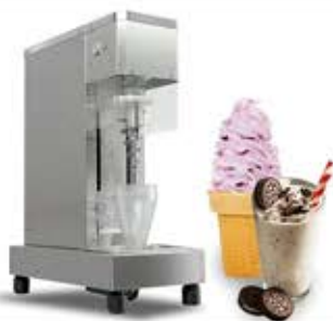
دستگاه شیکرمیوه و مغزیجات