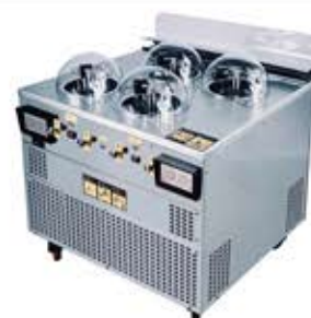
دستگاه بستنی ساز سه کاره