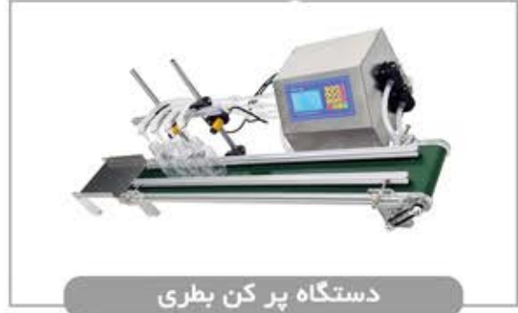
دستگاه پر کن بطری