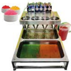
انواع خط تولید ( بابل تی)