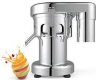
دستگاه آب هویج گیری