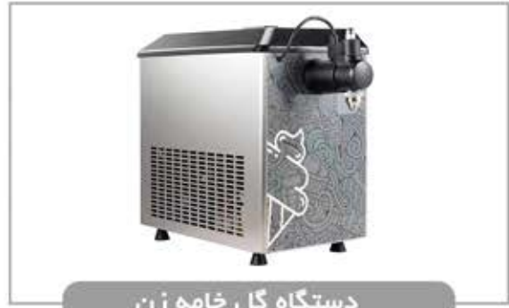
دستگاه گل خامه زن