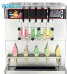
دستگاه بستنی قیفی